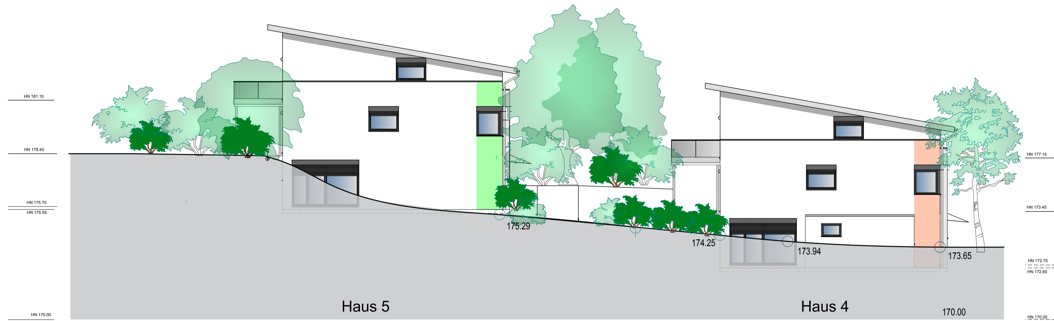
Ansicht Osten Dekan-Krämer-Weg